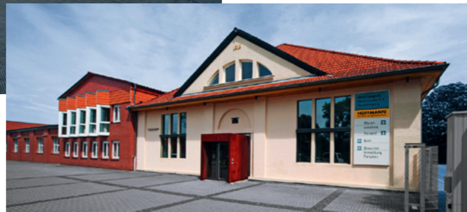
Stammsitz Werk Lengede