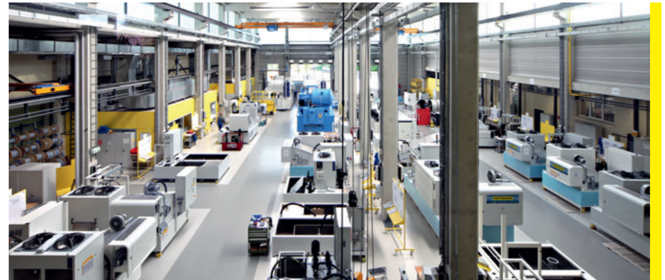
Filterfertigung in Lengede