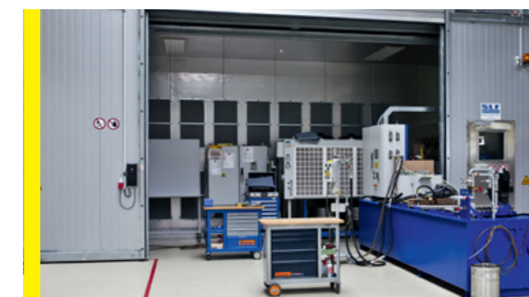
Leistungstest im Klimaraum