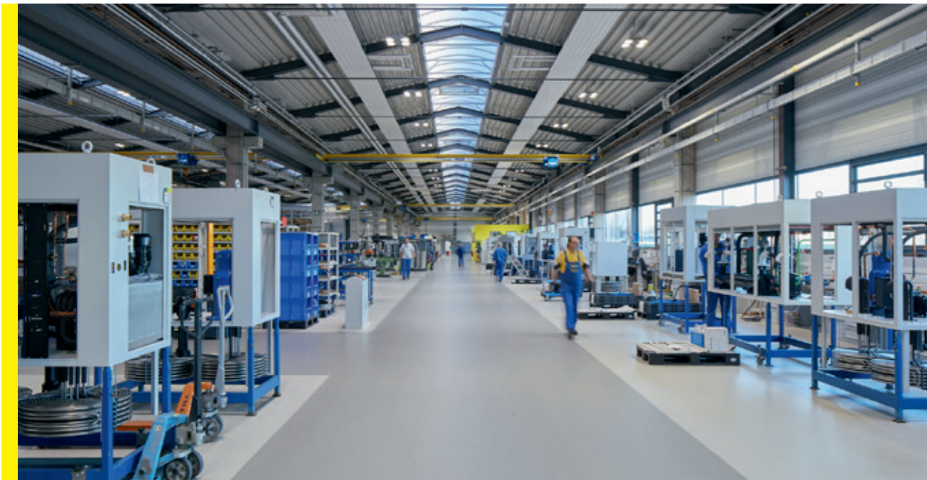
Kühlerfertigung in Broistedt