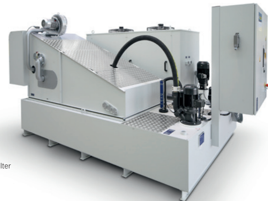
Unser Marktführer: Der HOFFMANN-Saugbandfilter